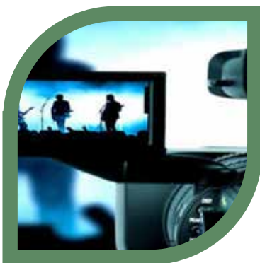
VIDEO PUBLICITARIO HD